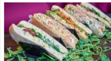
Genuss aus der Theke (gerne getoastet)