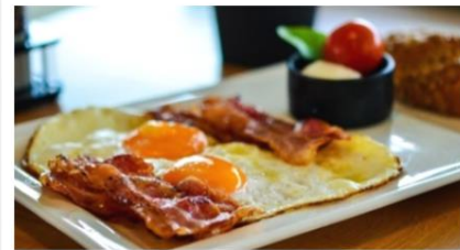
Bacon & Eggs