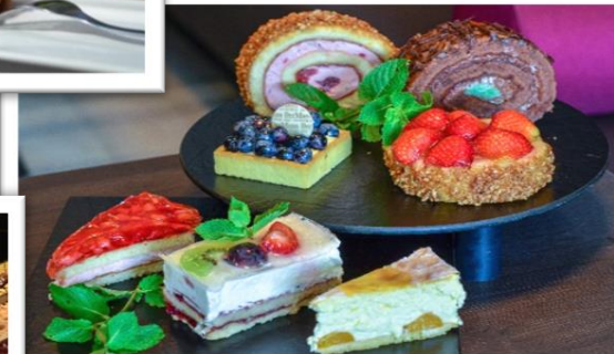
Genuss aus der Theke