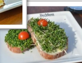
Schnittlauch- & Kressebrot