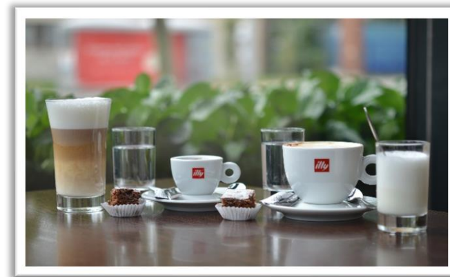
Kaffee von Illy