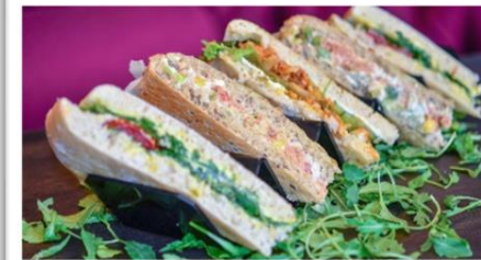
Genuss aus der Theke (gerne getoastet)