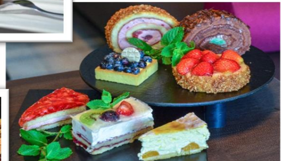
Genuss aus der Theke