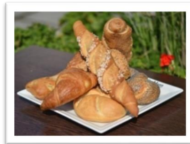
BROT- & Gebäckauswahl