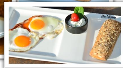
Ham & Eggs