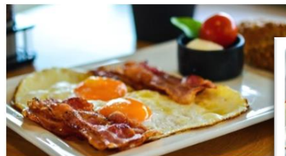
Bacon & Eggs