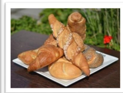
BROT- & Gebäckauswahl