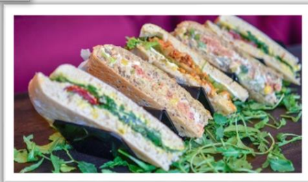
Genuss aus der Theke (gerne getoastet)