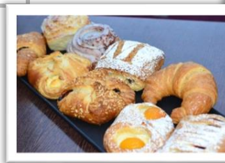
Genuss aus der Theke