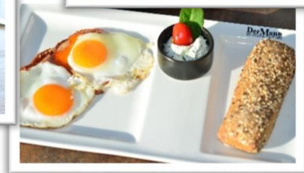
Ham & Eggs