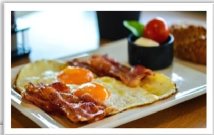
Bacon & Eggs