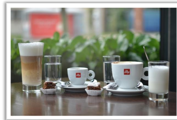
Kaffee von Illy