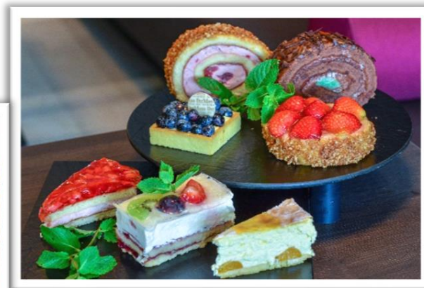
Genuss aus der Theke