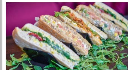
Genuss aus der Theke (gerne getoastet)